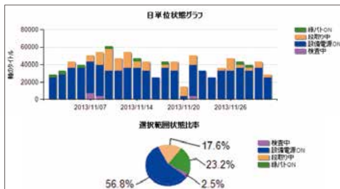
日単位状態グラフ/選択範囲状態比率

指定したライン単位で指定日と時間帯別の稼働集計表を表示・印刷します。また、データをCSVで出力できますので、エクセルなどに転記し、お客様が自由に活用可能です。稼働日誌を作業者の手間をかけずに自動作成できます。また集計期間指定による設備別稼働週報や月報も出力が可能です。