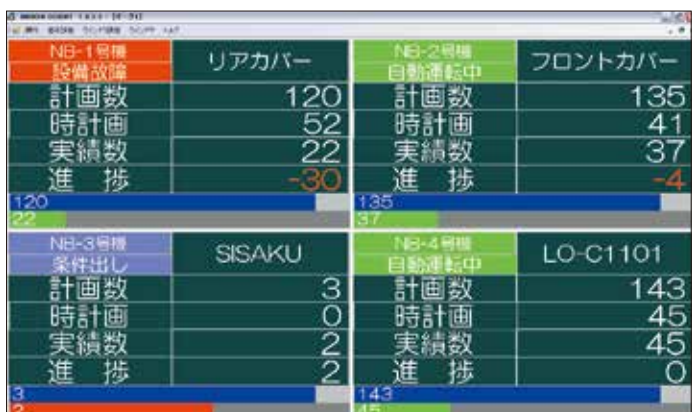
マルチあんどん(オプション)

振返りモニター(詳細表示例)指定したラインを現在から過去24時間迄さかのぼりリアルタイムでグラフ表示をします。時間の経過とともにグラフは右から左へ自動更新しますので、いつでも最新の状況を見る(振返る)事ができます。現場や事務所にて大型画面で表示し現場の意識を高めています。