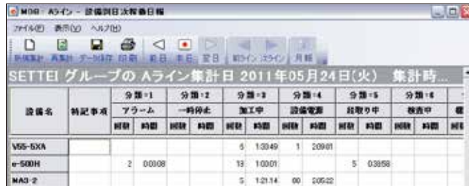
稼働日誌/稼働月報