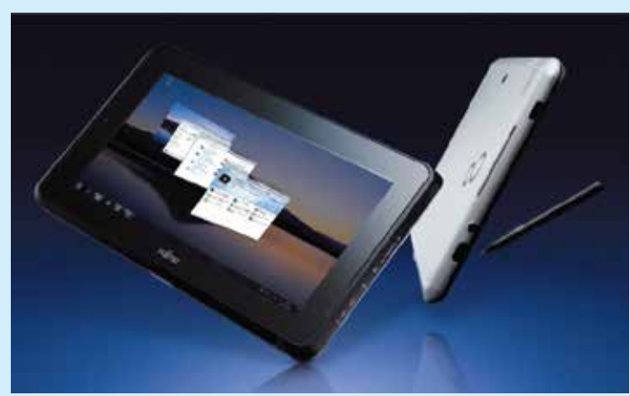
薄さ16.2mm、重さ730gのコンパクトボディで製造現場に必要な機能を搭載